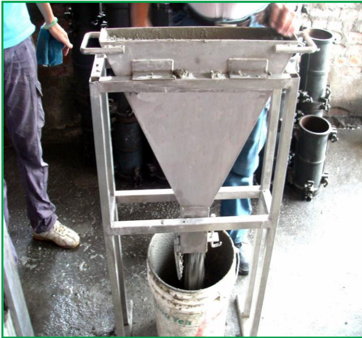
SCC R1 V 型槽填充流動開始(10~20 秒) V 型槽填充計時開始 13 秒完成