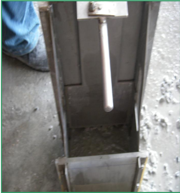
SCC R1 U 型槽填充流動開始