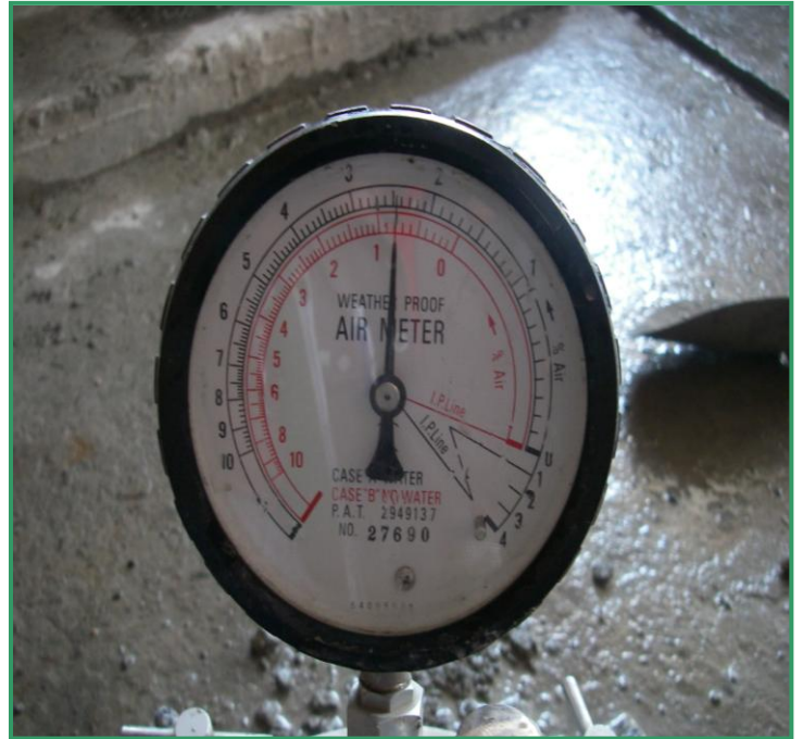
自充填流動化混凝土空氣含量規範 4% 以內 經空氣含量測試為含氣量 2.5%