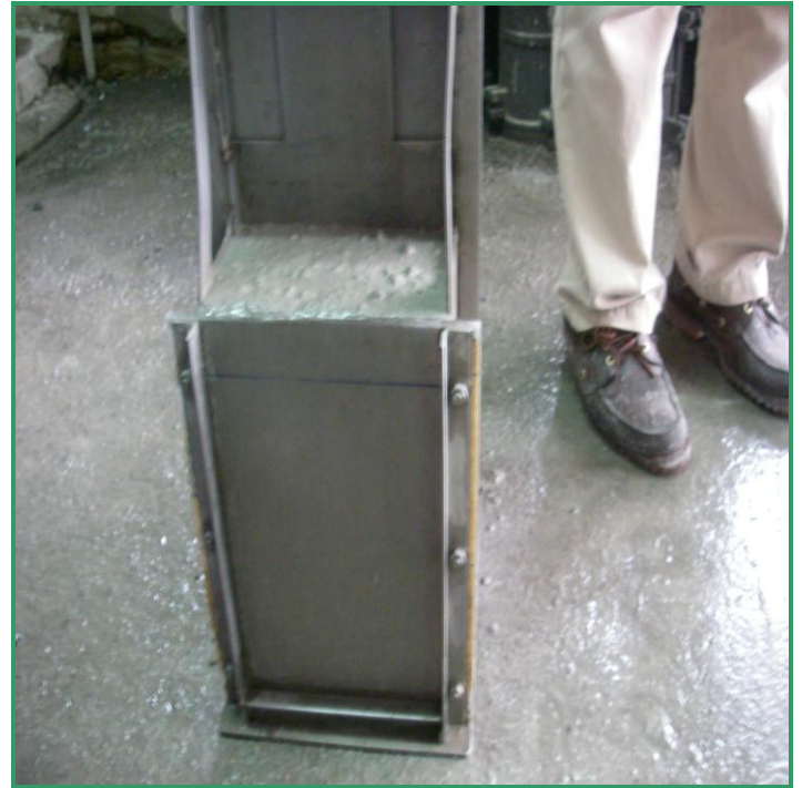
SCC R1 U 型槽填充注滿高點