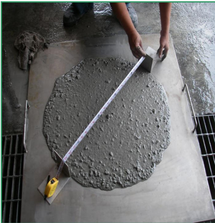
SCC R1 坍流度 65cm~75cm 通過 50 公分圓周時間 6.5 秒 0 分鐘初始坍流度 72cm